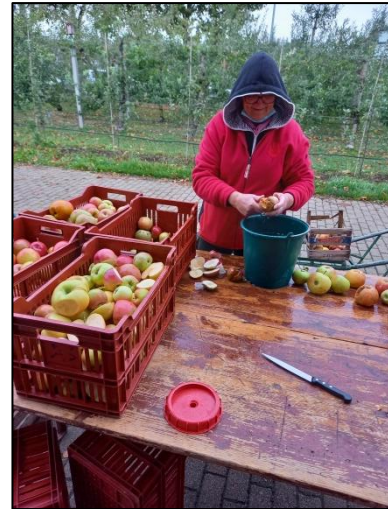
Récolte, lavage et tri des pommes