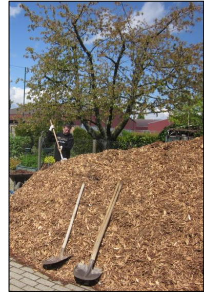
Epandage de mulch