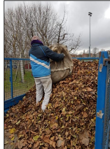
Ramassage de feuilles