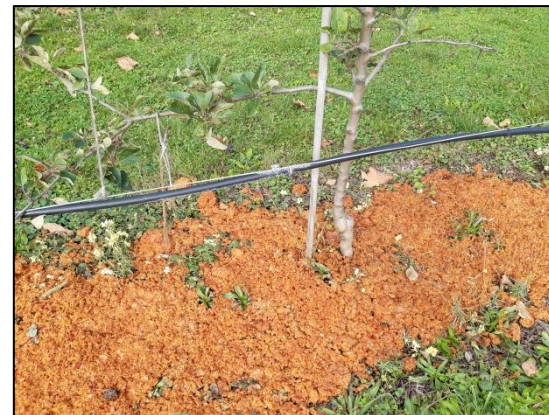
Rien ne se perd !